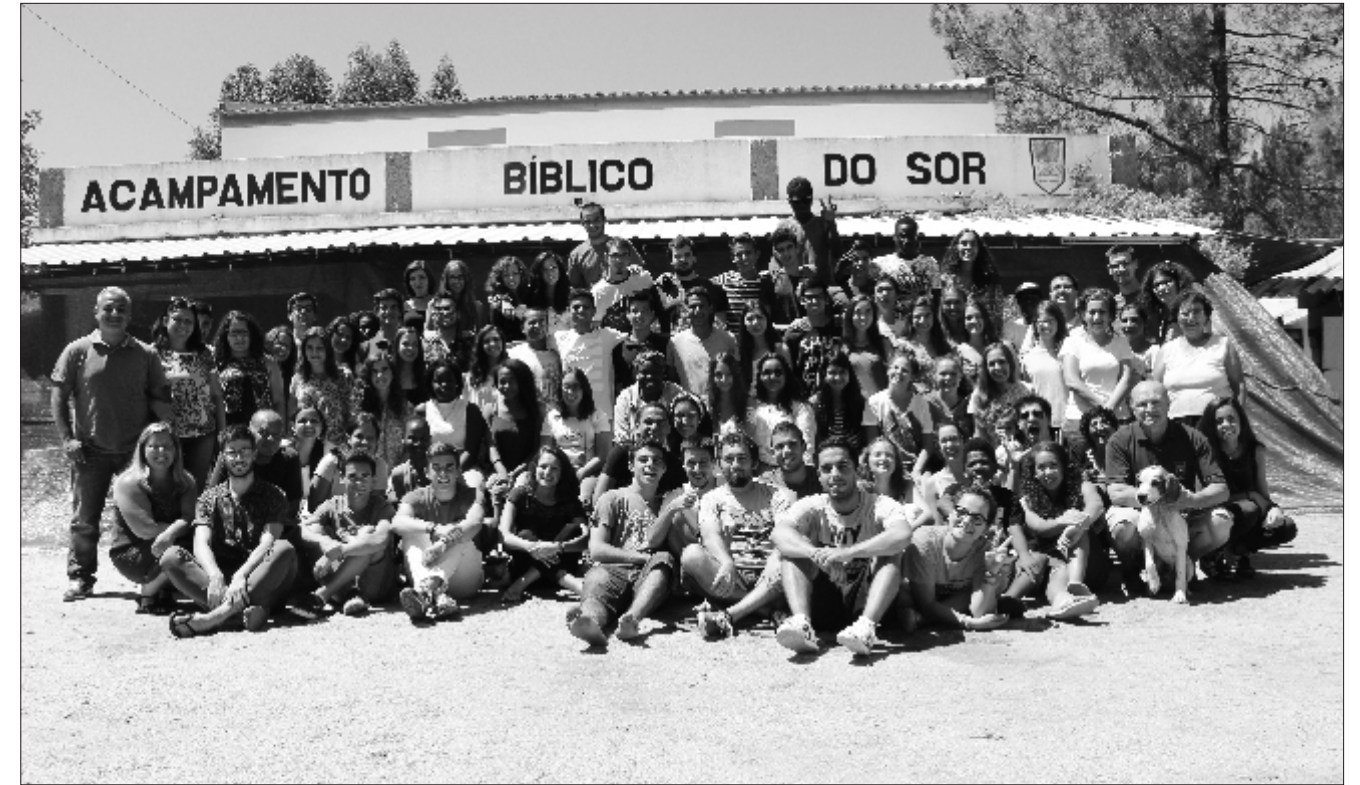
Fotografia de grupo do turno de Adolescentes & Jovens 2015.

Também temos a alegria de ter “membros congregados” muito importantes na igreja. Refiro-me, claro está, às